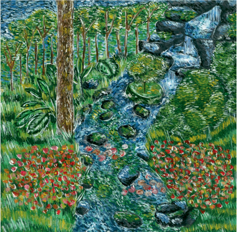
Jule Kohorst, EF „Mein Wunschort in Paderborn“ – Acryl auf Malpappe