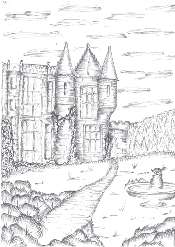
Ellen Moor, 9. Klasse „Landschaften im Fokus“ – Finelinerzeichnung