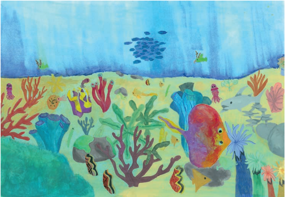
Frida Rimrod, 5. Klasse „Unterwasserwelten“ – Wassermalfarben