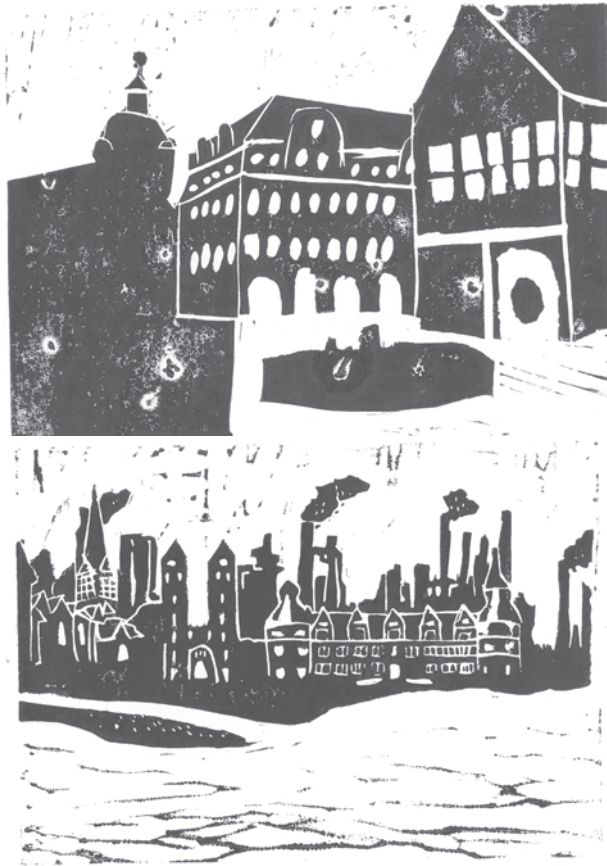
o.: Julius Strätling, u.: Lucie Suren 9. Klasse „Mein Wunschort in Paderborn“ – Linoldruck