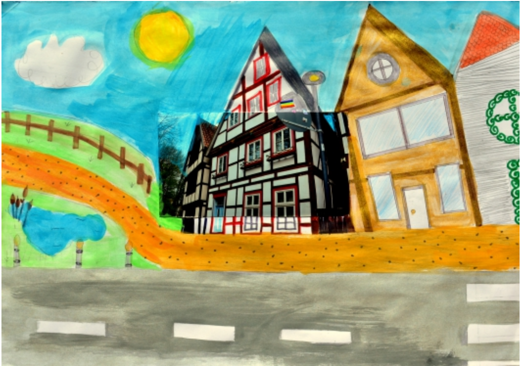
Isabella Lieder, 5. Kl., Paderborner Stadtansichten , Mischtechnik mit Fotografie