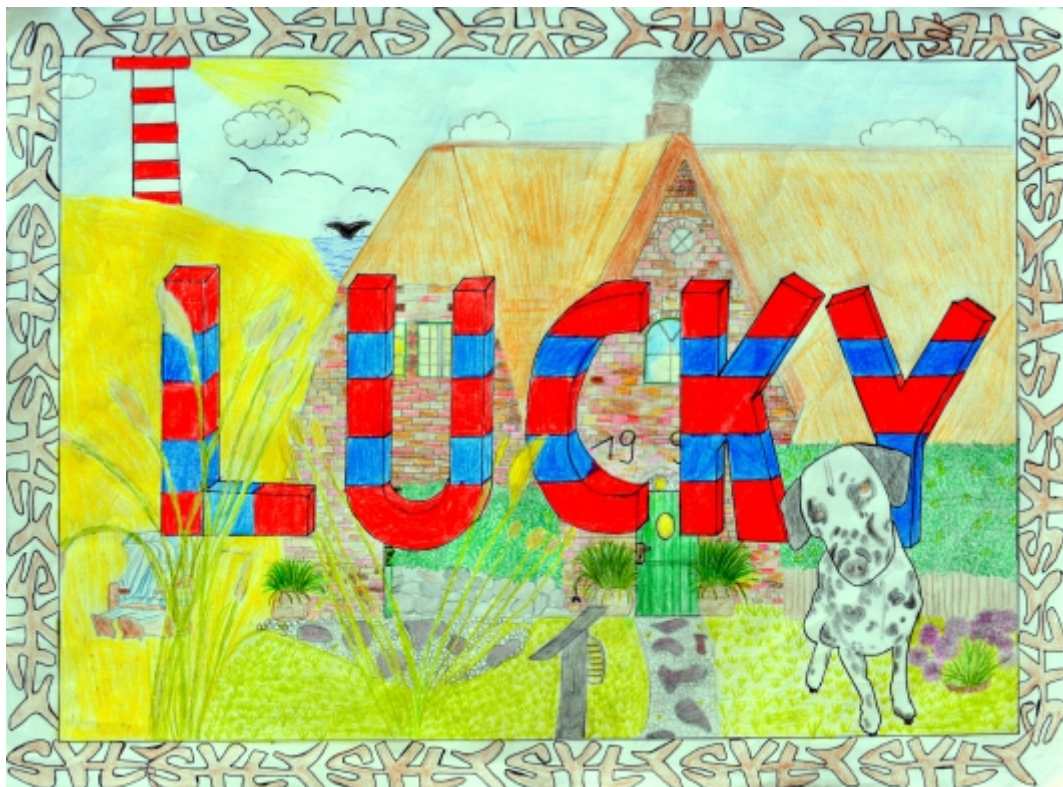
Antonia Schöning, 6. Kl., Ich in Parallelperspektive , Buntstift und Fineliner