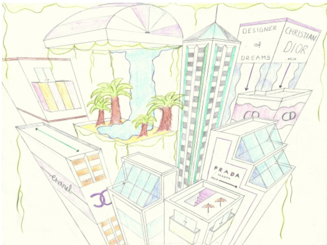
Maxime-Annabell Nergiz, 9. Kl., Stadtansicht mit Oase , Bleistift und Buntstift