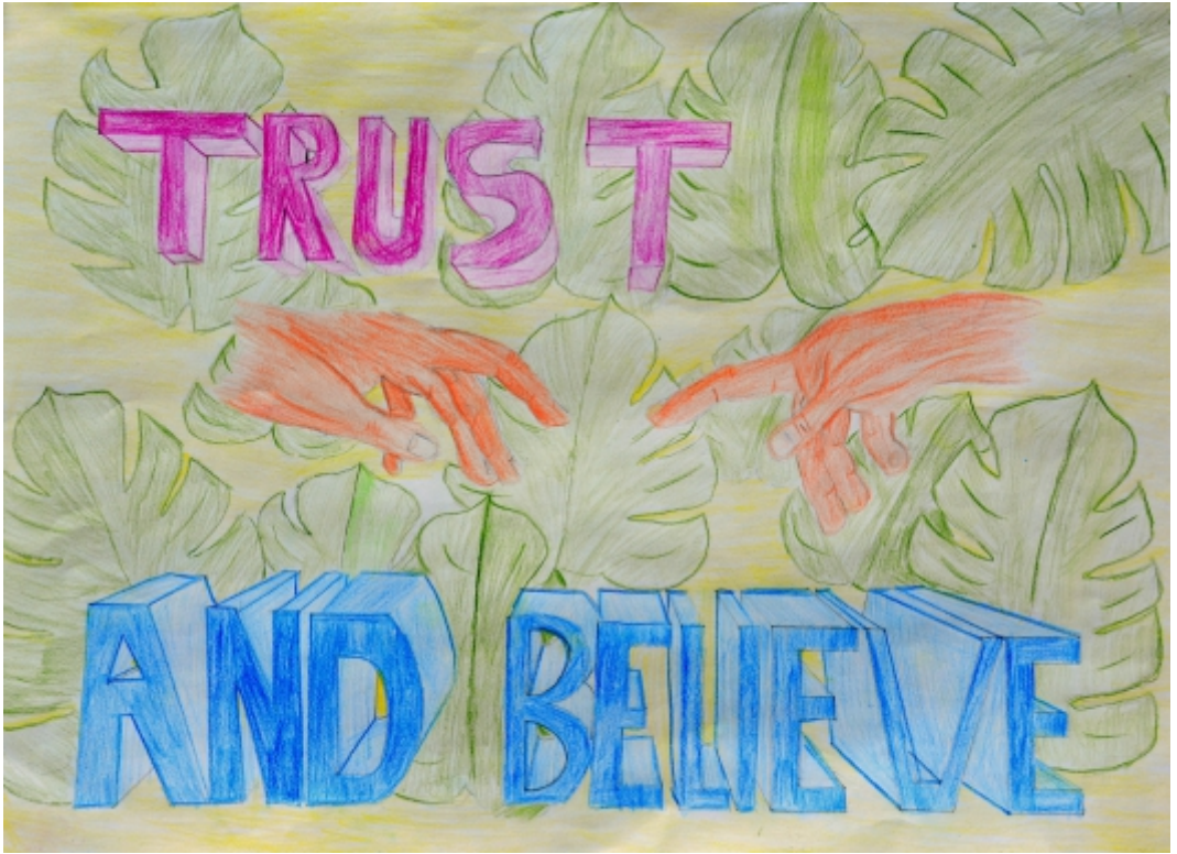
Elina Gertzen, 6. Kl., Postergestaltung in Parallelperspektive, Buntstift