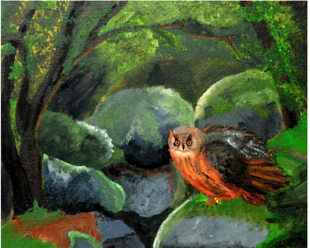
Sophie Gevorkian, EF, Tierische Begegnungen - Freund oder Feind? , Acryl auf Leinwand