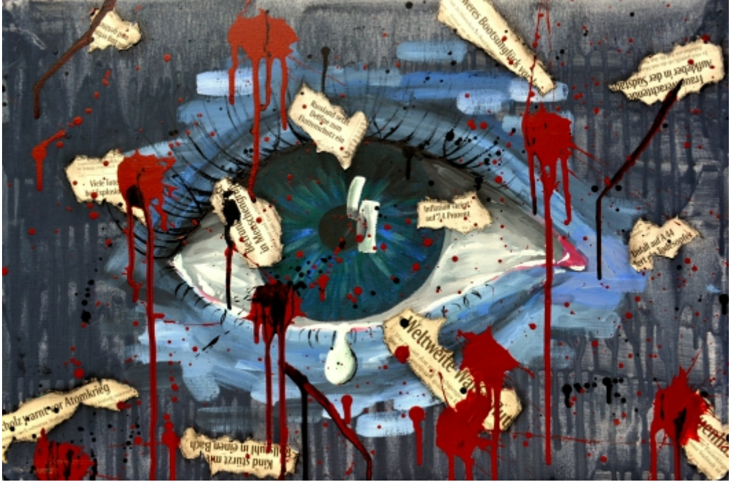
Luisa Schröder, EF, Bad News , Acryl und Collage auf Leinwand