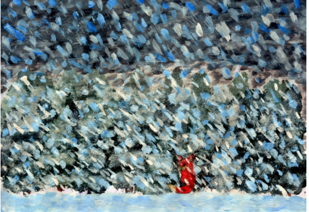
Maiara Köther, 6. Kl. Bewegte Landschaft - Fuchs im Schnee , Acryl auf Papier