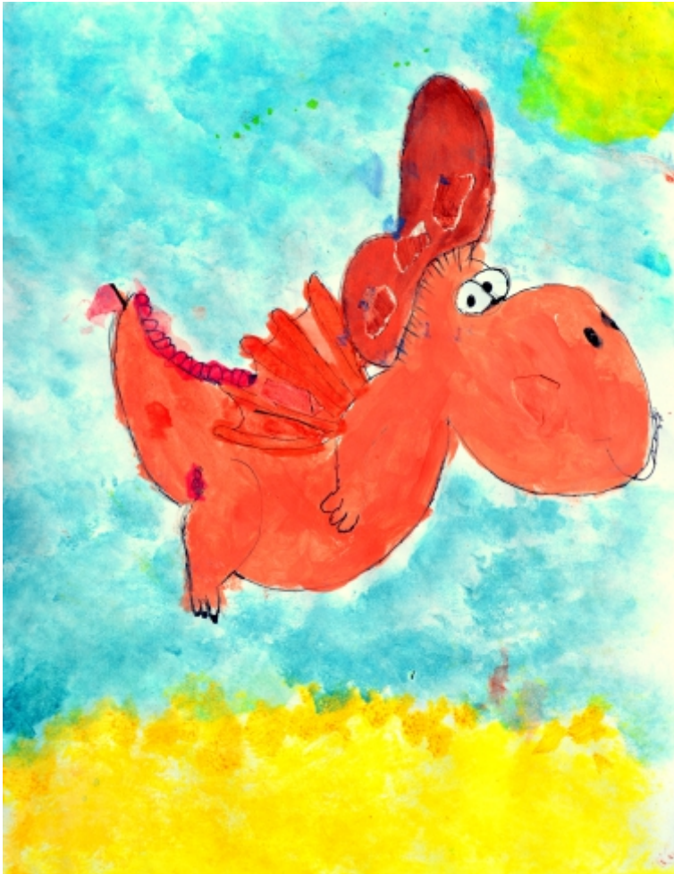
Jennifer Segith, 5. Kl., Rottöne - Drachenkleid , Deckfarben und Filzstift