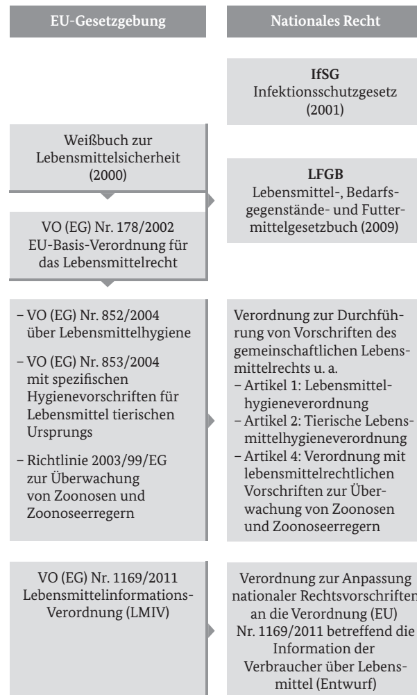
Abbildung 1: Übersicht über die rechtlichen Rahmenbedingungen in der Gemeinschaftsverpflegung

Außerdem wird die Anwendung einschlägiger DIN-Normen (zum Beispiel 10508 Temperaturen für Lebensmittel, 10526 Rückstellproben in der GV, 10524 Arbeitskleidung, 10514 Hygieneschulung) empfohlen. 42